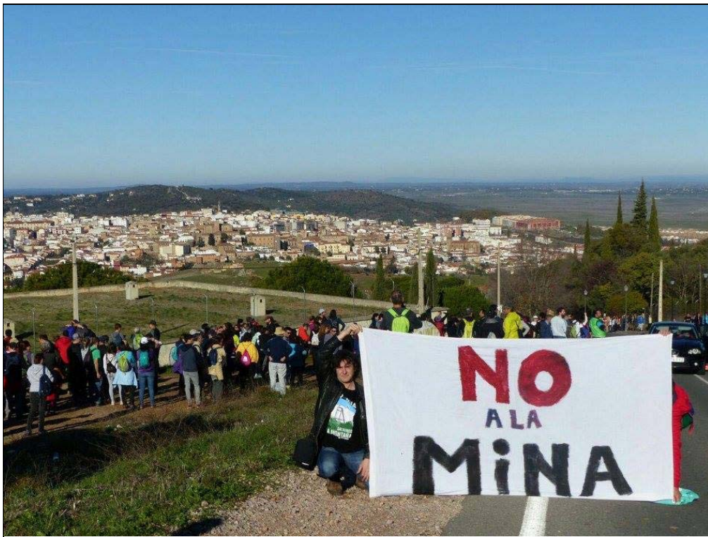
Cáceres no quiere una mina de litio, revista Público , 01/02/2018