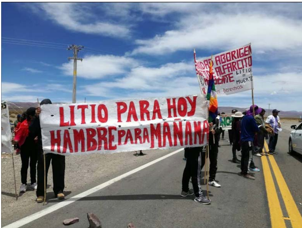
Manifestación de indígenas en Argentina contra la explotación del litio, World Rainforest Movement , 22.07.2023